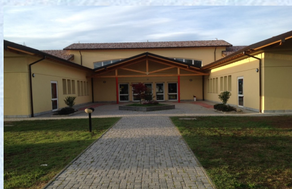
Scuola dell'infanzia ristrutturata