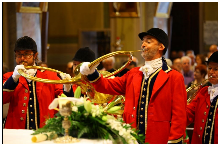
8 settembre 2013: prima festa di S. Uberto con suonatori di corni da caccia dell'Equipaggio della Accademia di Sant'Uberto di Torino.