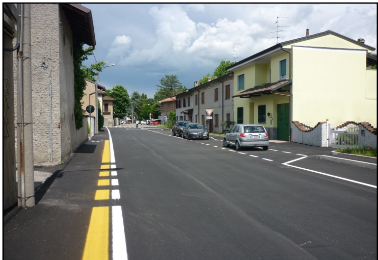
Via Novara a Malvaglio dopo la sistemazione.

La manifestazione è aperta a tutti i cittadini